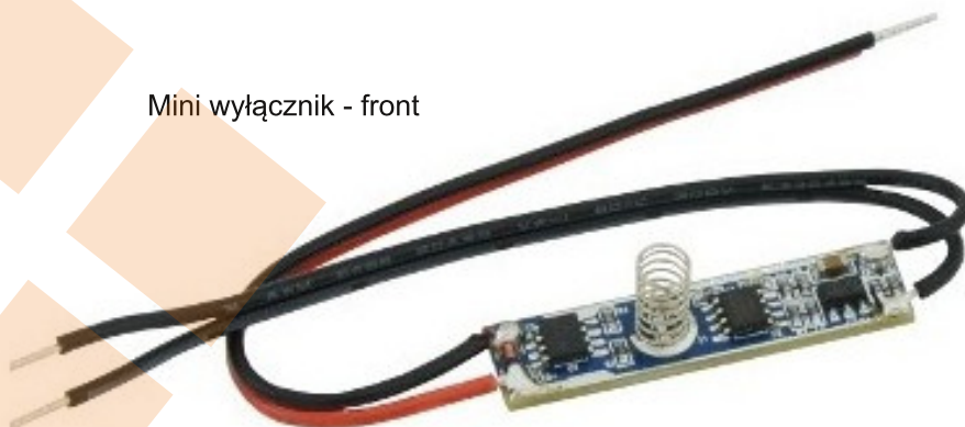
Mini wyłącznik - front